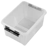
9 Dimensioni mm. capacità lt 330x250x170 9