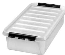
35 Dimensioni mm. capacità lt 720x400x200 35