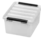
2 Dimensioni mm. capacità lt 210x170x110 2