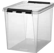
16 Dimensioni mm. capacità lt 400x300x320 16