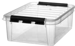
24 Dimensioni mm. capacità lt 500x390x180 24