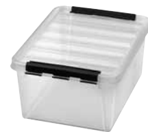
31 Dimensioni mm. capacità lt 500x390x260 31