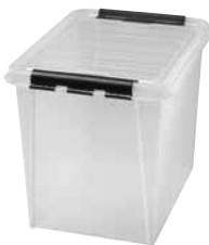
50 Dimensioni mm. capacità lt 500x390x410 50