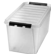
70 Dimensioni mm. capacità lt 720x400x390 70