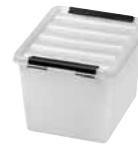
3 Dimensioni mm. capacità lt 210x170x150 3