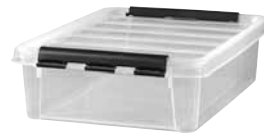
14 Dimensioni mm. capacità lt 400x300x120 14