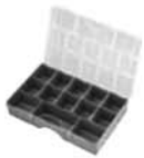
24 Dimensioni mm. capacità lt 250x160x40 24